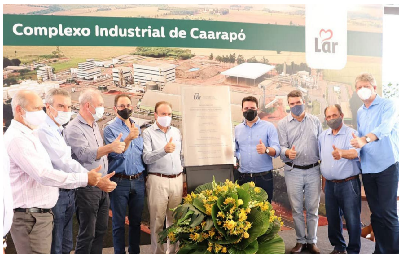
A LAR é responsável pelo recebimento de cerca de 18% dos grãos do Mato Grosso do Sul.