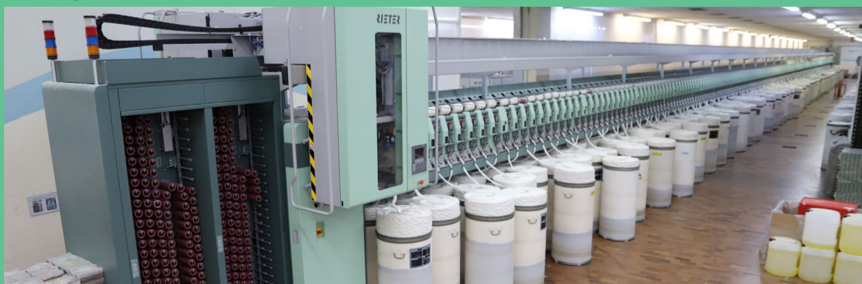
Com a máquina em funcionamento a capacidade de produção da Fiação deve aumentar para 1400 toneladas por mês.

A busca pela modernização na Fiação de Algodão da Copasul é constante desde os primeiros dias de existência da indústria e, recentemente, foi iniciado o processo de montagem de uma fiadeira/bobinadeira automática inédita em solo brasileiro. A Rieter R70, com 500 rotores foi um investimento de R$ 750 mil Euros. A montagem na Fiação é também uma das primeiras a ocorrer do mundo.