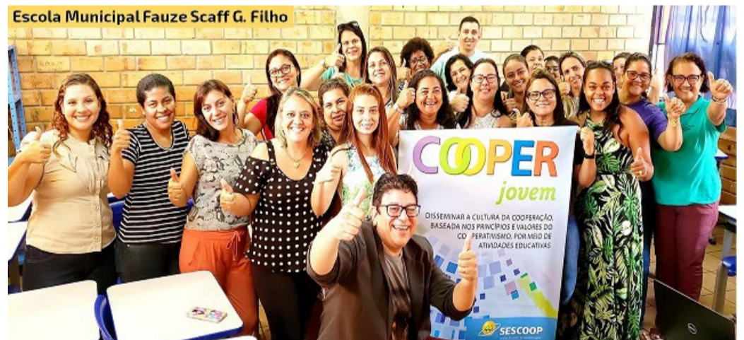
Projetos das cooperativas de MS reconhecidas no Prêmio Somoscoop.